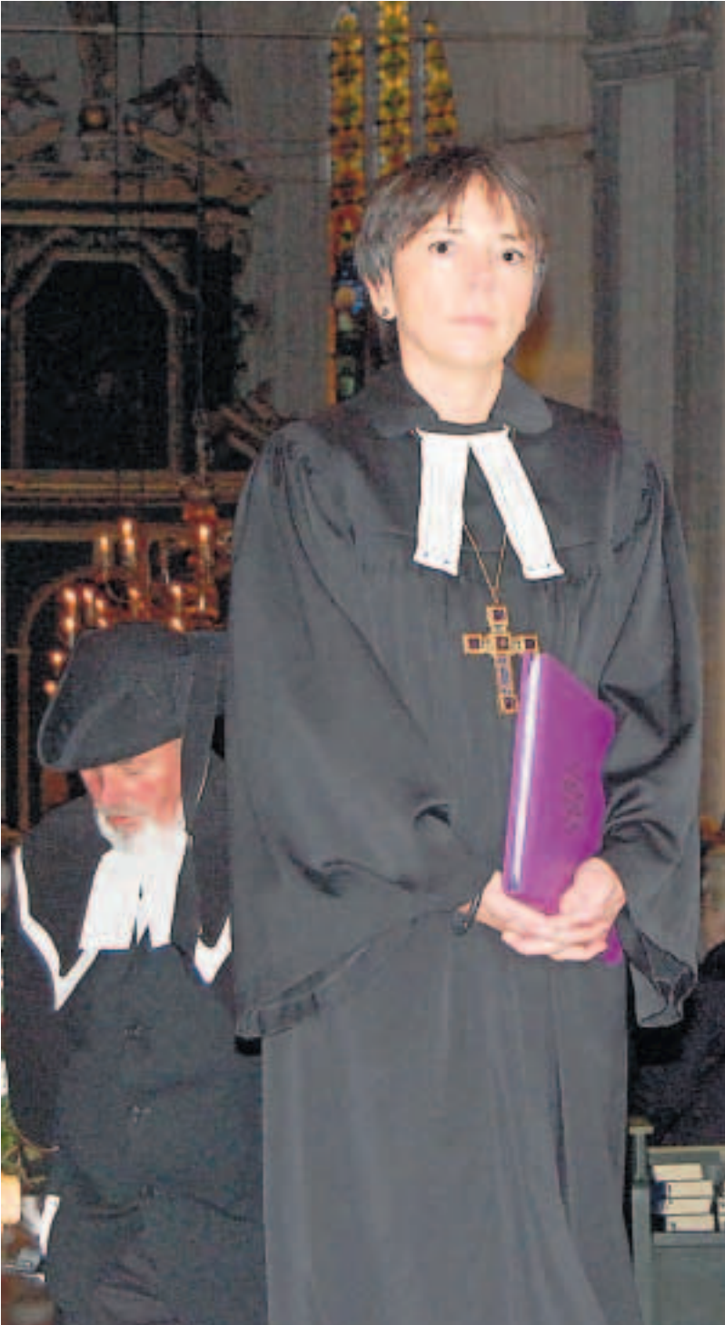
Kirchenoberhaupt Margot Käßmann beim Auszug aus der voll besetzten St.-Wilhadi-Kirche in Stade.

Zum Beruf des Theologen war Manfred Horch erst über den zweiten Bildungsweg gekommen. Bevor er das Kirchenamt für sich entdeckte, hatte er eine Berufsausbildung zum Zahntechniker absolviert. (stu)