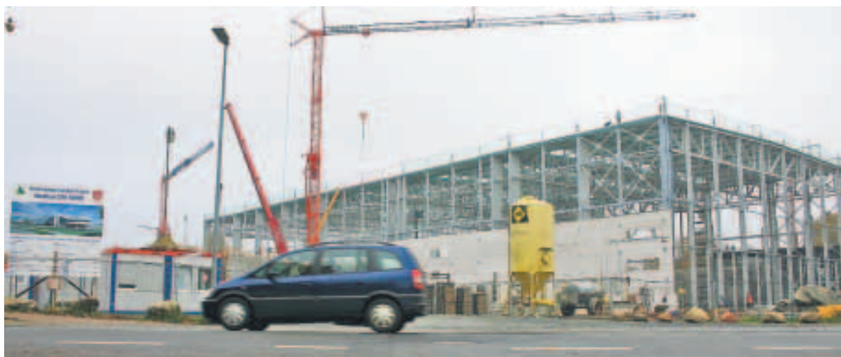
Stades neue Großbaustelle in Ottenbeck: Das Gerüst der Halle des CFK-Forschungszentrums steht bereits.

Universitätsinstitute und der Verein CFK-Valley. 96 Prozent der Flächen seien fest vermietet, so Friedrichs. Und das beruhigt ihn, denn nur über die Mieteinnahmen ist der frei finanzierte Anteil der städtischen Tochtergesellschaft von rund sieben Millionen Euro (netto) zu bezahlen. Das Land Niedersachsen bezuschusst den Neubau mit 19,7 Millionen Euro und gibt weitere zweistellige Millionenbeträge in den kommenden fünf Jahren für die Forschungsprojekte. (pa)